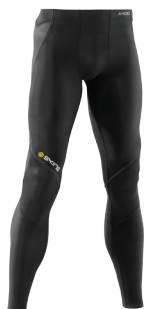
Men's Long Tights