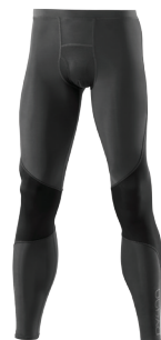
Women's Long Tights