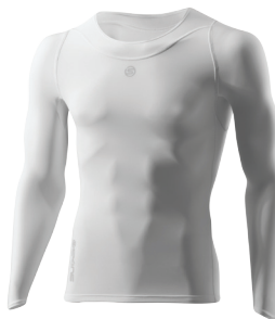
Men's Long Sleeve Top